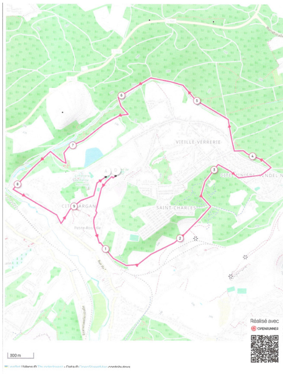
Circuit 10 km