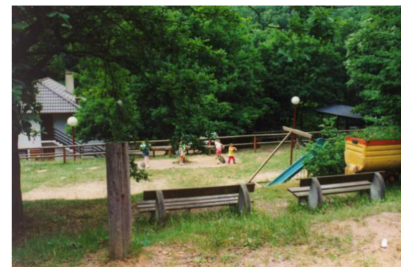
Terrains de jeux